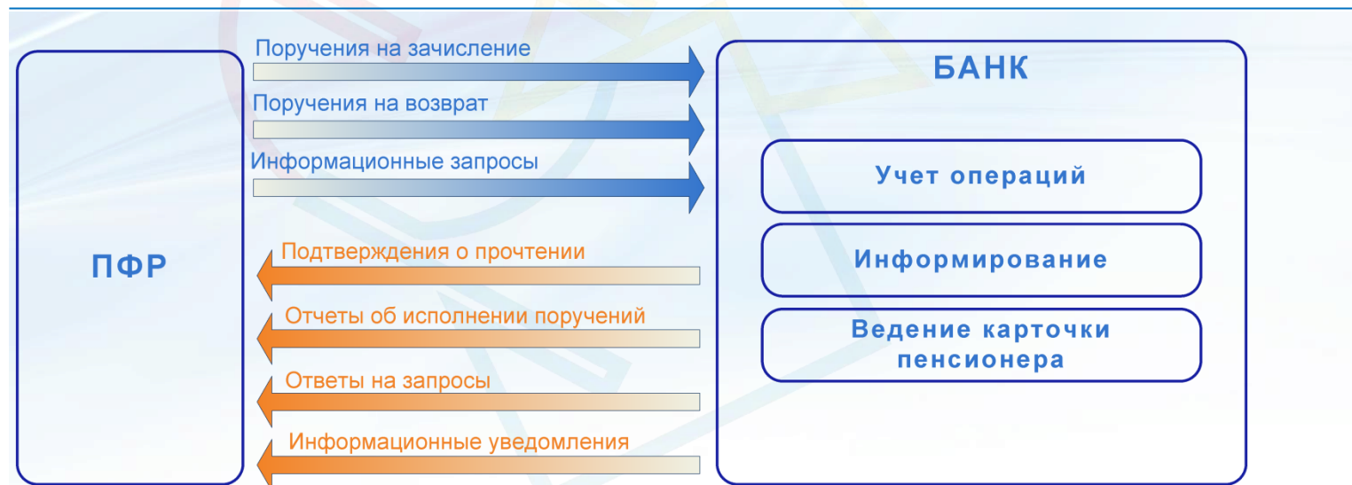
Схема информационного взаимодействия